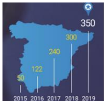
Evolución do nº edificios unidos á causa segundo pasan os anos

NESTE DÍA DE CELEBRACIÓN, VEN VESTIDO CON PARTE DE ENRIBA AZUL- ÚNETE Á CAUSA!