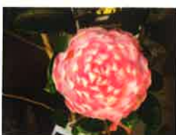
Taça da Famosura