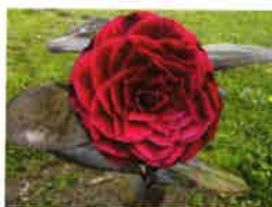
Real Leaf Bella